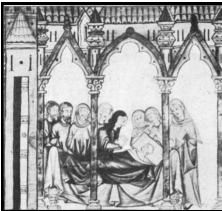
Cantiga 167, Hijo muerto (Ms T-I-1, fol. 224r)

a mia esperança creo / que vossa perfia vença. Ca eu levarei meu fillo / a Salas desta vegada con ssa omagen de cera, / que ja lle tenno comprada, e velarei na igreja / da mui benaventurada Santa Maria, e tenno / que de mia coita se sença.” (vv. 17- 23)