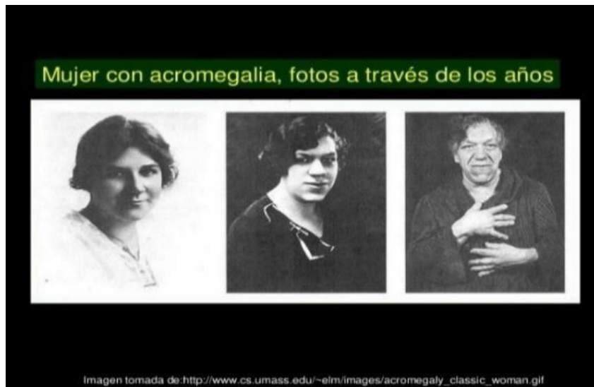
Fig 2. Acromegalia